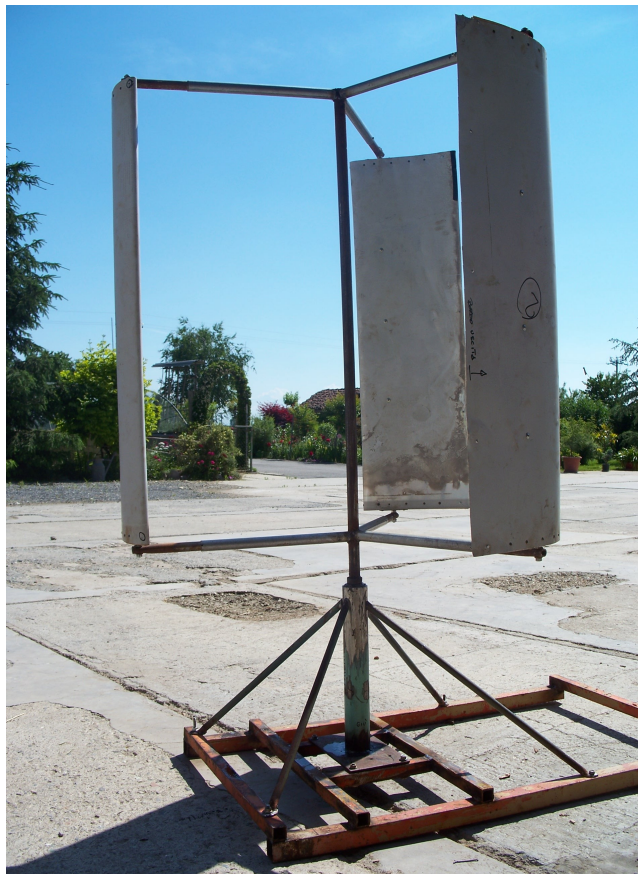
[ primo prototipo di VentolONE ]